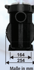
Maße in mm